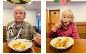
▲バースデイ お好み焼き♥