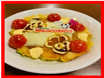
ふんわり焼くのが美味しさのコツ！

一丁目の2月の誕生者はお二人。お一人おひとりご要望を聞き、食べものや洋服など欲しい物をプレゼントしました。午後のおやつには先月のリクエストにお応えして、お好み焼きパーティーを開き、皆で食べながら誕生者のお祝いをしました。